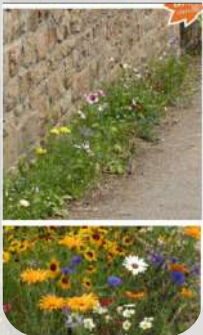
Flours Pieds de Murs.

Les allées seront prochainement enherbées, les pieds de murs recevront des semis de fleurs pour colorer et amener de la diversité, des espaces appelés " fleurs coupées ou champêtres" seront destinés à fournir pour les administrés des plantes à cueillir pour les tombes. Dans l'avenir, des plantes grimpantes ou des arbres pourront être plantés.