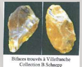
Bifaces trouvés à Villefranche Collection B. Schnepf

Le saviez-vous ? On pense parfois qu'on ne trouve plus de traces d'avant le Moyen-Âge ou l'Antiquité, mais on a des preuves que des humains ont vécu dans la vallée du Cher depuis des dizaines et même des centaines de milliers d'années ! Et pas seulement dans la vallée, mais sur le territoire même de notre commune de Villefranche. Ces preuves sont des pierres taillées :